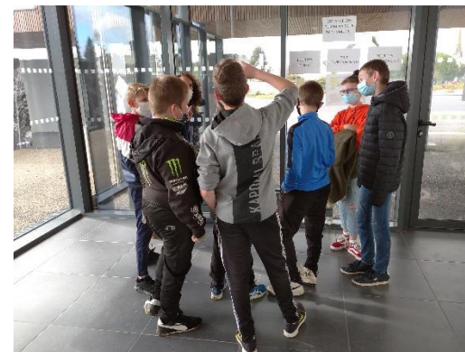
Octobre 2020 -Forum au collège des monts d'Arrée