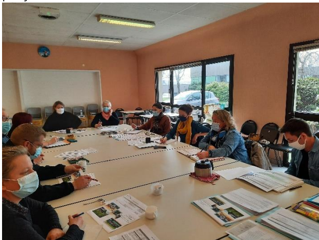
Mars 2021- comité de pilotage

Pour ce temps de réécriture, nous avons mobilisé un nouveau comité de pilotage afin d'apporter un souffle nouveau, des idées novatrices à notre projet.