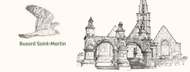
1 Église et enclos paroissial