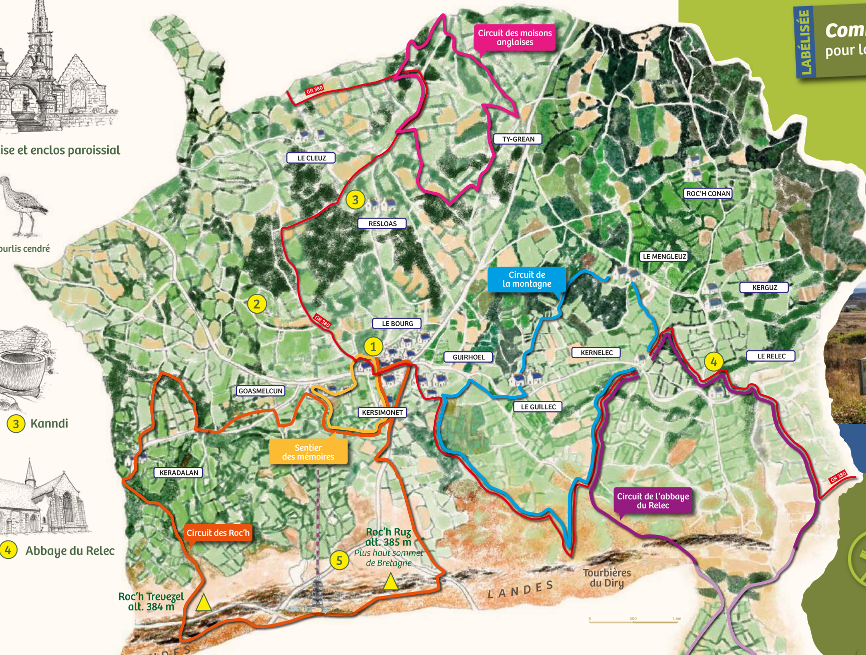
5 Roc'h Trédudon

Circuit des Roc'h Départ place de l'église 15 km Balisage jaune