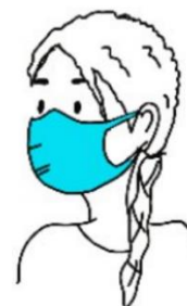
COUVRANT LE NEZ, LA BOUCHE, LE MENTON