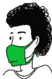
PAS ASSEZ SERRÉ