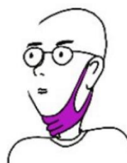
SOUS LE MENTON