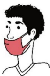
SOUS LE NEZ